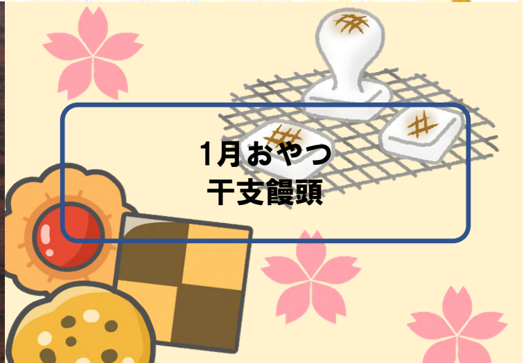
1月おやつ 干支饅頭