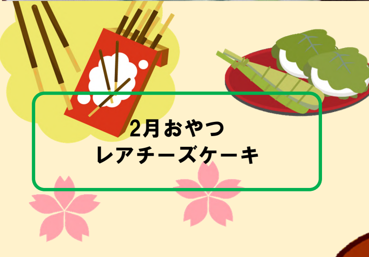
2月おやつ レアチーズケーキ