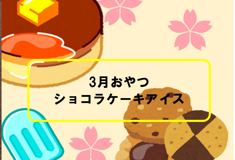
3月おやつ ショコラケーキアイス